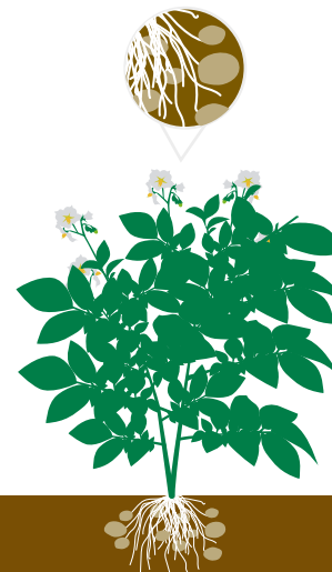
Crescimento de tubérculos