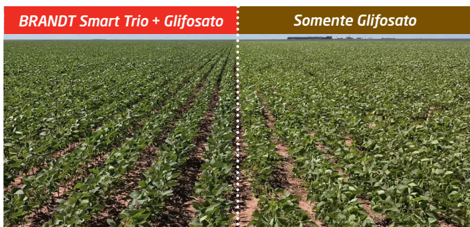
Lavoura de soja em Luiz Eduardo Magalhães/BA. Safra 2017/2018.

Reduza o estresse causado por herbicidas com o BRANDT Smart Trio®