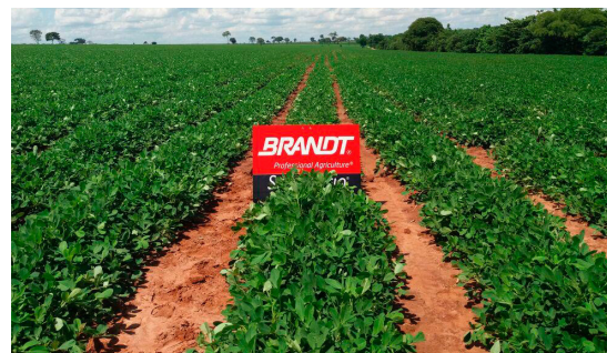
Amendoim após aplicação de BRANDT Trend e BRANDT Smart Trio em José Bonifácio, SP Safra 2017/2018