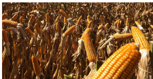
Milho tratado com produtos BRANDT em Sorriso, MT - Safra 2017/2018