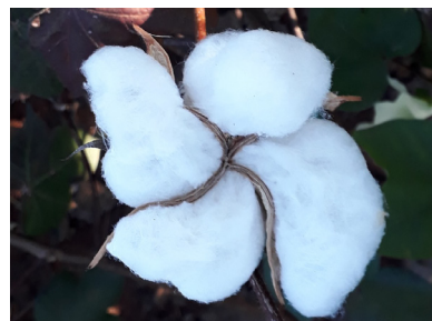
Algodão em Rio Verde, GO - 2018