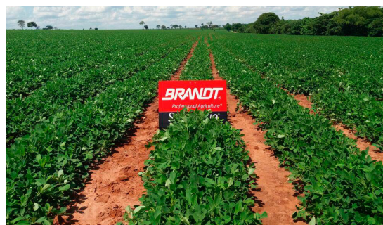
Amendoim após aplicação de Target Trend e BRANDT Smart Trio em José Bonifácio, SP Safra 2017/2018